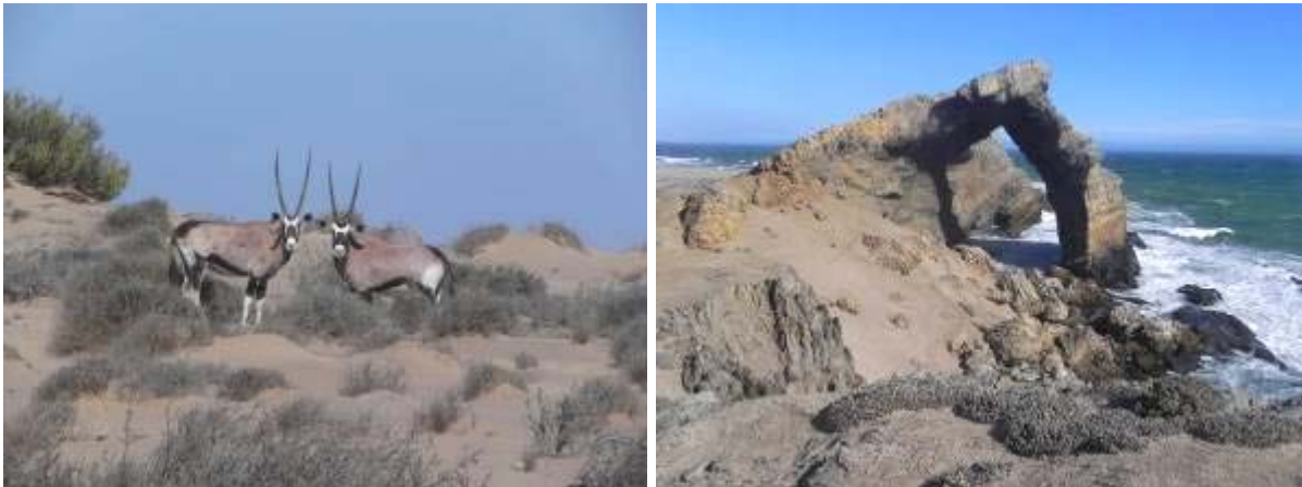
Spießböcke sind bestens an die wüstenhaften Bedingungen angepasste Tiere (li). Der Bogenfels im Diamantensperrgebiet ist eine beeindruckende geologische Formation (re).

Namibia, das ehemalige Südwestafrika und einstige Kolonialgebiet der Deutschen ist ein faszinierendes Land. Hier findet man die älteste Wüste, die Namib, mit den weltweit höchsten Dünen, ein reiches Tierleben, geologische Besonderheiten und Reste des Gondwanalandes, Dinosaurierspuren, Aloe-Wälder, Lebende Steine, den 2. größten Canyon der Erde, Kolonial- und Geisterstädte, Spuren des ehemaligen Diamantenfiebers, und vieles mehr. In Namibia gibt es immer was zu sehen, viele wollen bleiben und man kann verstehen warum.