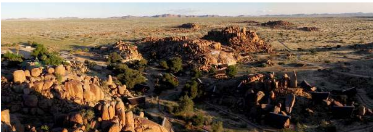
Faszinierende Landschaft bei der Canon Lodge im Gondwana Park in der Nähe des Fish-River Canyons.

Vortrag zur Reise: Donnerstag, 6.10.2011, 18.00 Uhr, Zentrum für Biodiversität, Rennweg 14, 1030 Wien (Hörsaal)