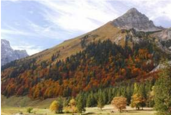
Karwendelgebirge im Herbst

Das Karwendel, eine Gebirgsgruppe der Nördlichen Kalkalpen das aus Kalkstein und Dolomit aufgebaut ist, zählt zu den schönsten Naturschönheiten Tirols. Besonders reizvoll ist das Gebiet im September, dann wenn die Herbstfärbung einsetzt und die Täler sich in bunte Landschaften verwandeln. Die schroffen und steilen Lalidererwände die bis zu 1.000 m aufragen, zeigen in besonders eindrucksvoller Weise den Aufbau und die Auffaltung des Gebirges. Der Achensee, der Besuch des Steinölmuseums und Wanderungen an wilden Wassern (Isartal) und auf uralten Almen dürfen dabei nicht fehlen, ebenso wie der Besuch der geschichtsträchtigen Silber-Stadt Hall in Tirol. Genießen, Staunen und auch das Kulinarische kommen bei diesem Herbstausflug nicht zu kurz.