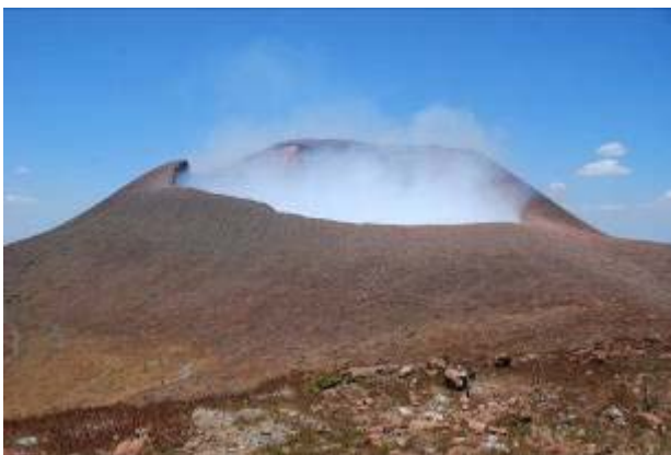
Nicaragua: Das Land der Vulkane (Bild: Vulkan Telica)