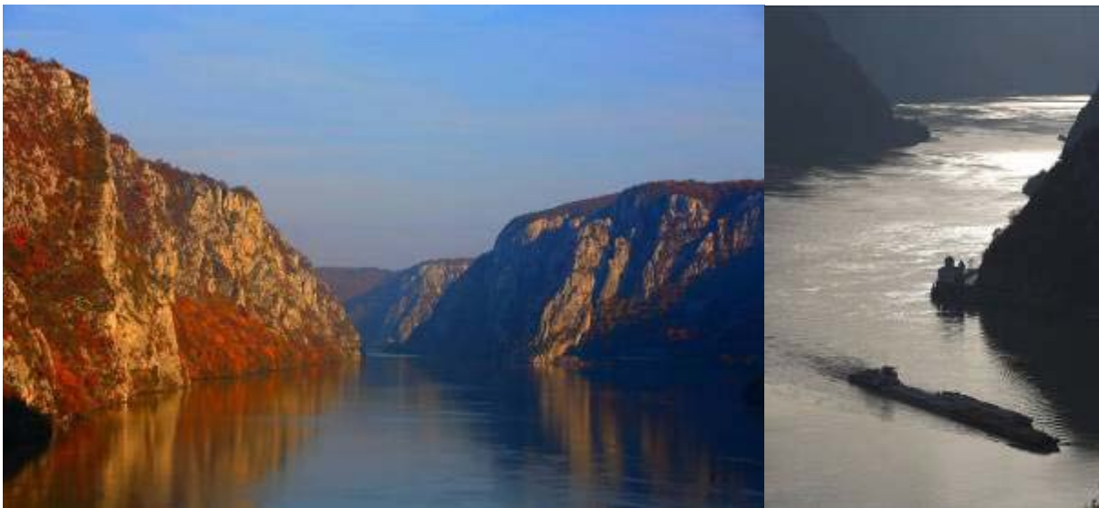
Donauabschnitt im Djerdap Nationalpark

Geysire, deren Fontänen bis zu fünf Meter hoch aus dem Boden schießen können im Nationalpark Kopaonik bestaunt werden. In der sog. Vojvodina, einer fruchtbaren Ebene in der Nähe Belgrads, befindet sich der artenreiche Nationalpark Fruška Gora. Der Park beherbergt die größten natürlichen Lindenwälder Europas, in dem u.a. Luchse, Hirsche und das Europäische Mufflon überleben konnten. Der Berg Fruška Gora ist auch eine wichtige Kultstätte der orthodoxen Christen, auf dem zwischen dem 12. und dem 18. Jahrhunderts 35 serbisch-orthodoxe Klöster errichtet wurden. Der Naturpark Đavolja Varoš mit seinen hunderten Erdpyramiden wurde sogar zu den Weltwundern nominiert. Serbien, ein Land so nah und für uns doch so unbekannt, ist für Natur- und Kulturliebhaber eine Reise wert.