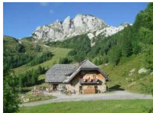
Watschigeralm mit Gartnerkofel im Hintergrund