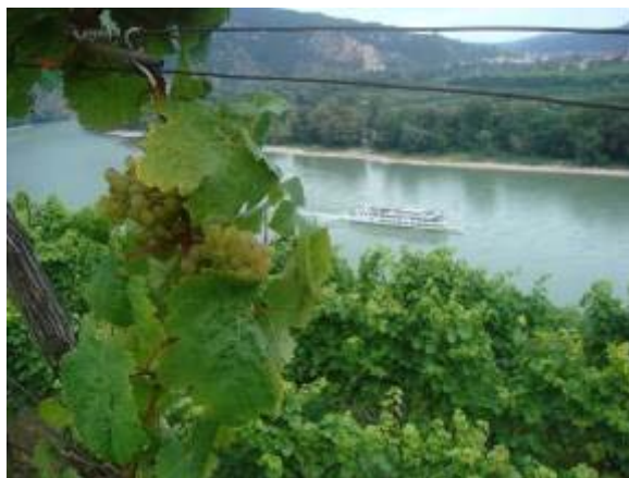
Die Wachau, die Donau und der Wein