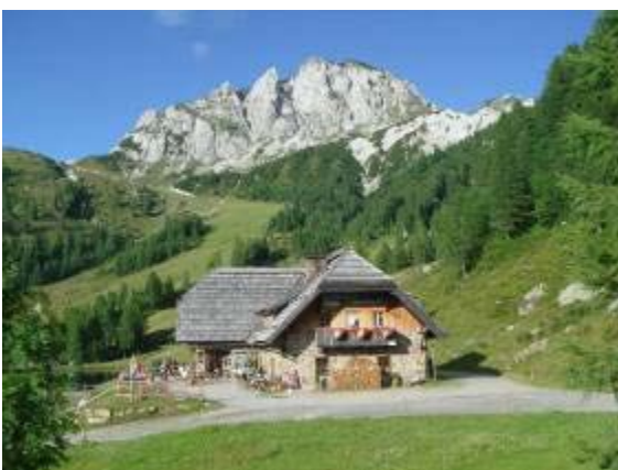
Watschigeralm mit Gartnerkofel im Hintergrund

Kosten: EUR 580,- im DZ bzw. 710,- im DZ mit Besuch in Carnia/Italien, Einzelzimmerzuschlag: auf Anfrage