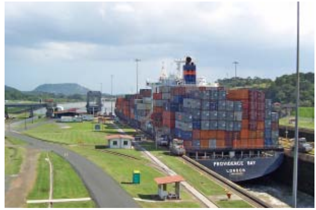
Panama: Das Land am Kanal