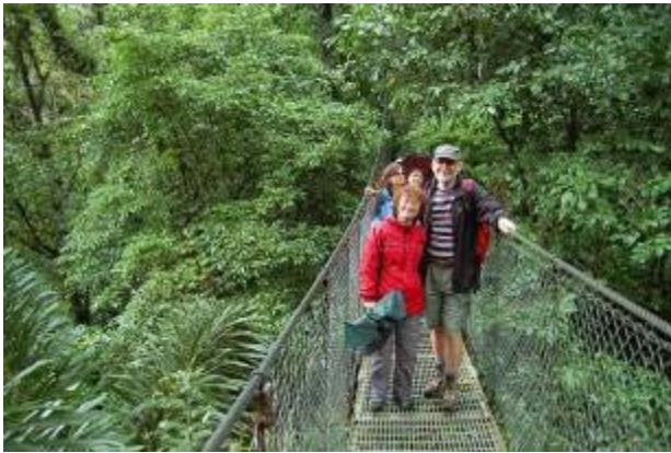
Costa Rica: Küsten, Berge und Regenwälder (Bild: Hängebrücken im Kronendach des Regenwaldes)

Diese NaturStudienReise durch 3 Länder Mittelamerikas führt Sie zu den schönsten und bemerkenswertesten Naturplätzen. Höhepunkte der Reise sind u.a die Vulkane Mombacho, Masaya, Cerro Negro und Telica, die Insel Ometepe im Lago Nicaragua, die Städte Granada und Leon in Nicaragua. In Costa Rica wandern wir in Monteverde auf Hängebrücken im Kronendach des Regenwaldes, besuchen den Nationalpark Rincon de la Vieja, die Pazifikküste von Dominical und den Regenwald der Österreicher mit der Tropenstation La Gamba. In Panama werden wir über die regenreichen Berge zur karibischen Inselwelt von Bocas del Toro fahren. Am Ende der Reise erleben wir die Städte Portobelo, Cristobal Colon und Panama-Stadt mit dem Panamakanal. Wie bei allen unseren Reisen steht das Erleben von Natur, Land und Leuten im Mittelpunkt, der Besuch von Märkten, Verkostungen von tropischen Früchten und kulinarischen Köstlichkeiten runden die Reise ab.