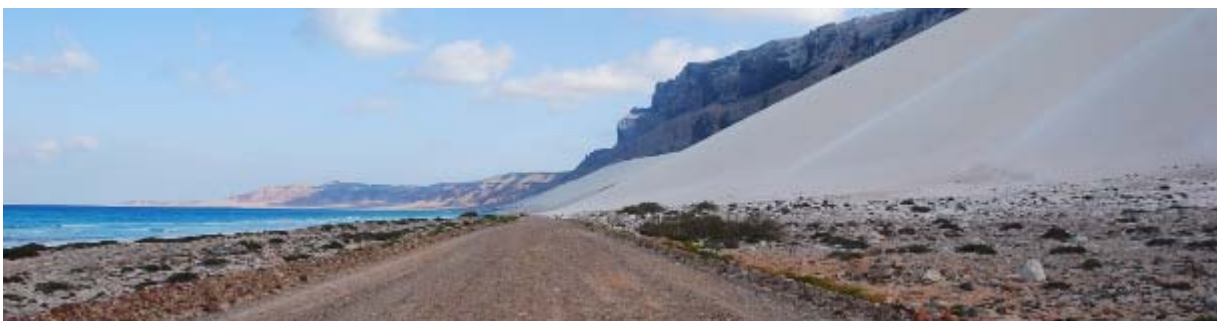
Sanddünen an der Küste von Arher

Vortrag zur Reise: Mittwoch, 2. Mai 2012 um 18:00 Uhr, Zentrum für Biodiversität, Rennweg 14, 1030 Wien (Hörsaal)